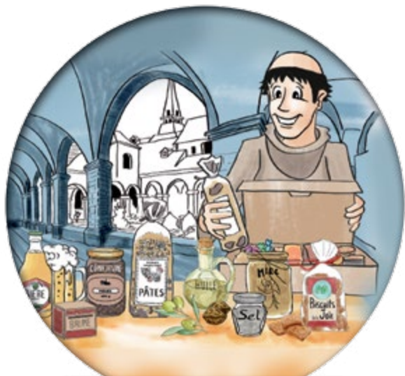
La première box des monastères